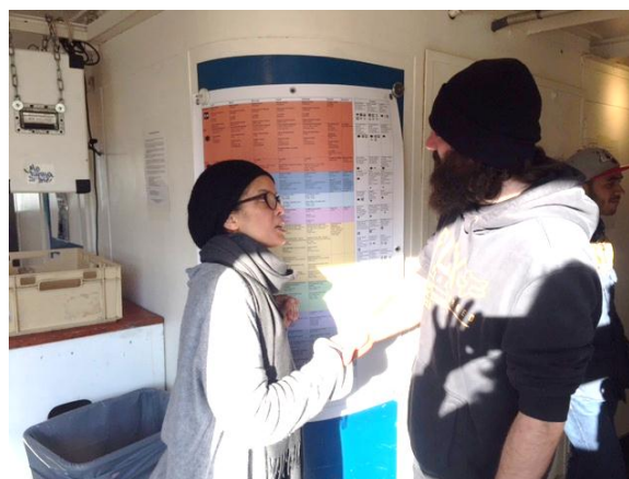
Une guide expliquant à un passager les lieux d'accueil d'urgence.

Mis en place depuis près de 10 ans, le projet « pairs » est une véritable opportunité pour les personnes, car il leur permet de reprendre confiance en eux, de jouer un rôle utile dans la société et de leur donner un statut social. En 2016, 14 passagers ont eu le rôle de guide.