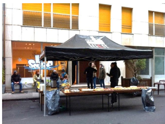
Stand du Bateau prêt à accueillir des passagers le 25 décembre 2016.

Instaurée depuis plusieurs années, la tartine itinérante est un petit-déjeuner gratuit organisé sur l'espace public pour rendre visibles nos prestations et les problèmes auxquels nos bénéficiaires font face. Organisée en collaboration avec l'association la Source (lieu de rencontre pour adolescents à côté du Bateau), les tartines ont eu lieu du 25 au 30 décembre 2016.